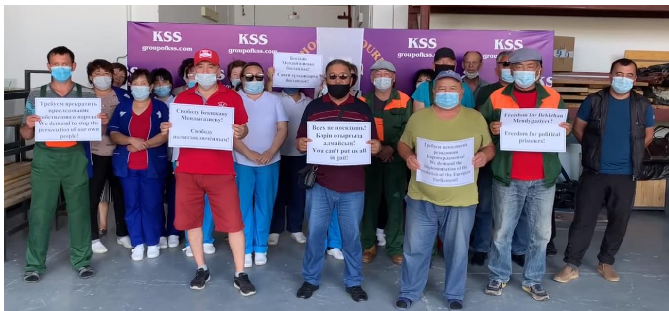
Сотрудники KSS протестуют против политически мотивированного преследования.