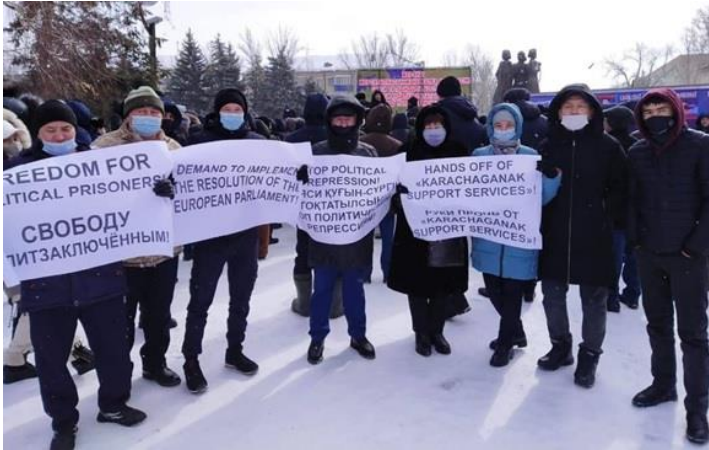
Акция протеста сотрудников KSS 28.02.2021.